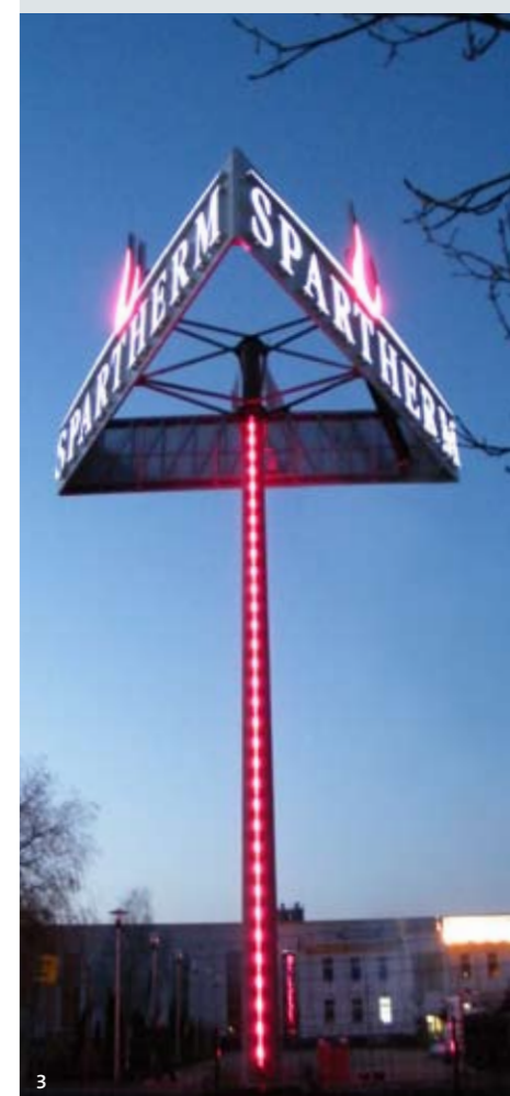
(1) IKEA, Kamen (2) Stahlgittermast (3) Spartherm, Gorzow/Polen