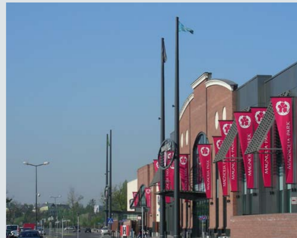
(1) Galeria Pestka, Posen/Polen (2) Einkaufsgebiet, Tychy/Polen (3) IKEA, Vallecas/Spanien (4) IKEA, Dubai/VAE (5) Galeria Magnolia, Legnica/Polen