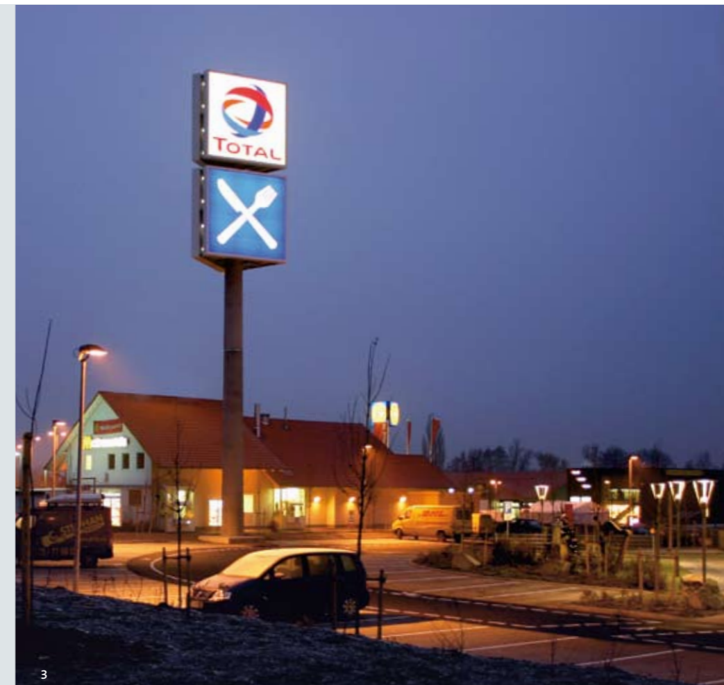
(1) Autohof Parsberg (an der A3) (2) Autohof Neumarkt (an der A3) (3) Autohof Werneck (an der A70)